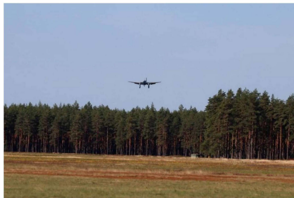
Så här såg det ut när B17-planet kom över trädtopparna och gick ner för landning på Krigsflygfält 16.

Filmerna som blir cirka tio minuter långa har en budget på runt 1,5 miljoner kronor där bland annat Försvarmakten, Saab, Länsstyrelsen i Värmland och Leader Närheten bidrar med pengar.