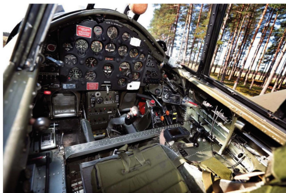
Det finns bara två Saab B17 kvar i Sverige. Detta plan visar normalt upp sig fyra, fem gånger om året på bland annat stora flygdagar. Det levererades till Flygvapnet 1943 och renoverades 1997.

– För att bygga på den känslan kommer vi bland annat ha kameror under planet, säger regissören Jesper Wachtmeister.